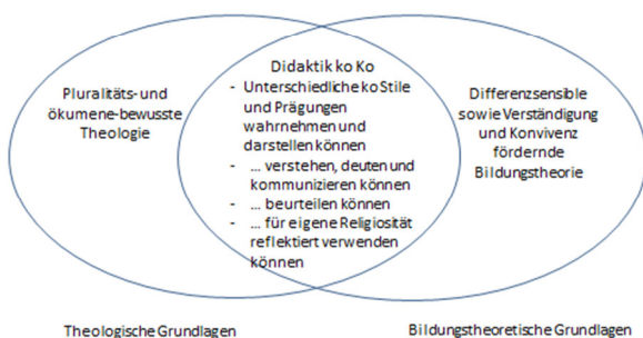
Didaktik konfessionell-kooperativer Lernprozesse